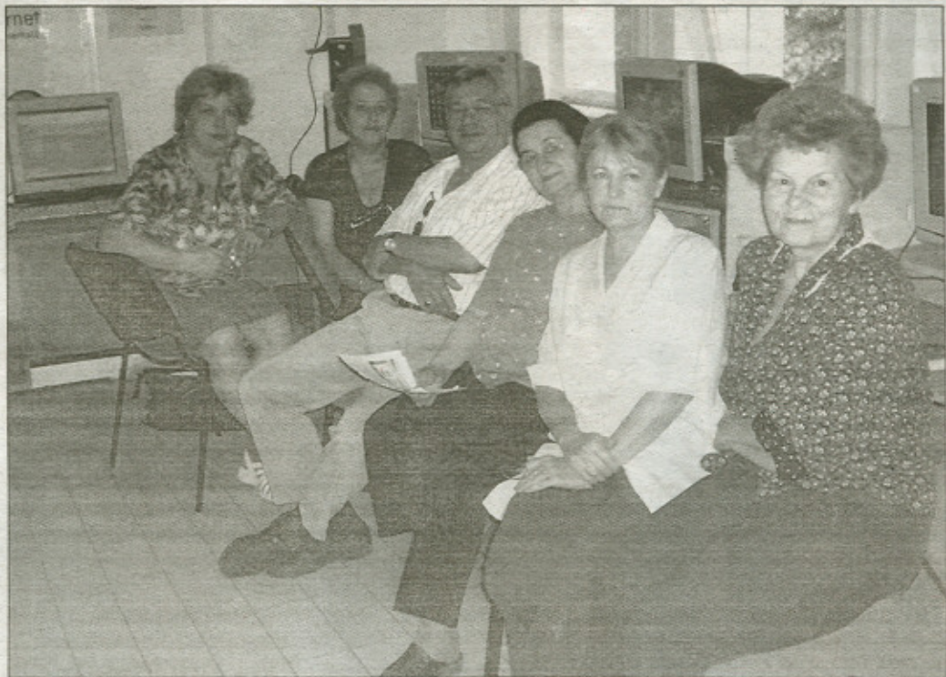
Az alakuló ülésen nem csak nagymama korosztály vett részt, hanem fiatalabbak is